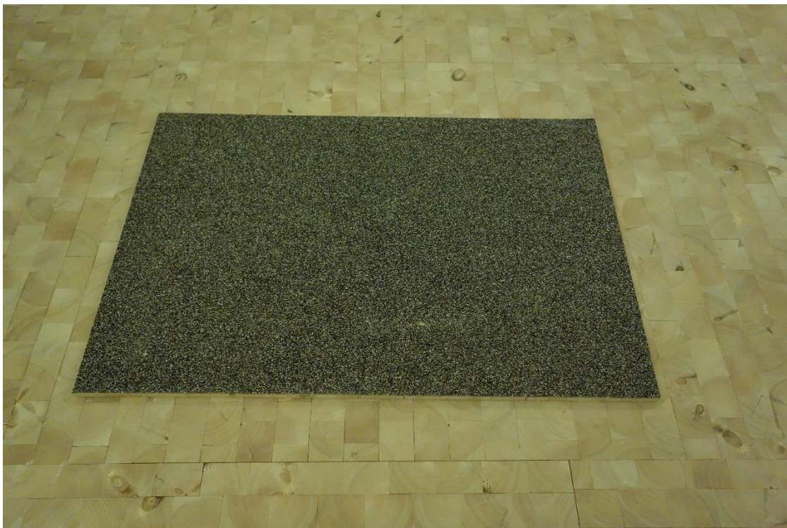
Bild 2 – En golvskiva med kubbar visad underifrån med den stegljudsdämpande korkbeläggningen synlig.