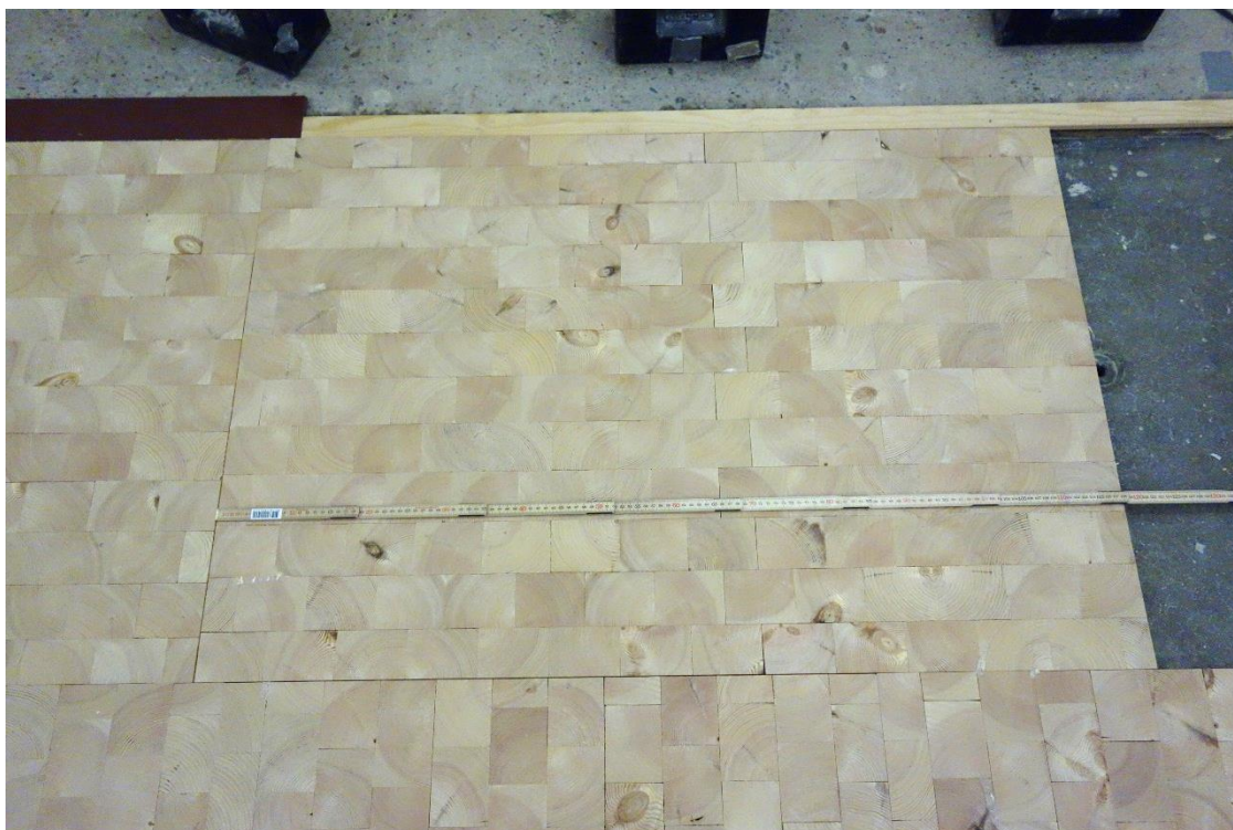
Bild 1 – Kubbgolv under montage. Måttstocken visar gränsen för utbredning för en golvskiva med kubbar på.