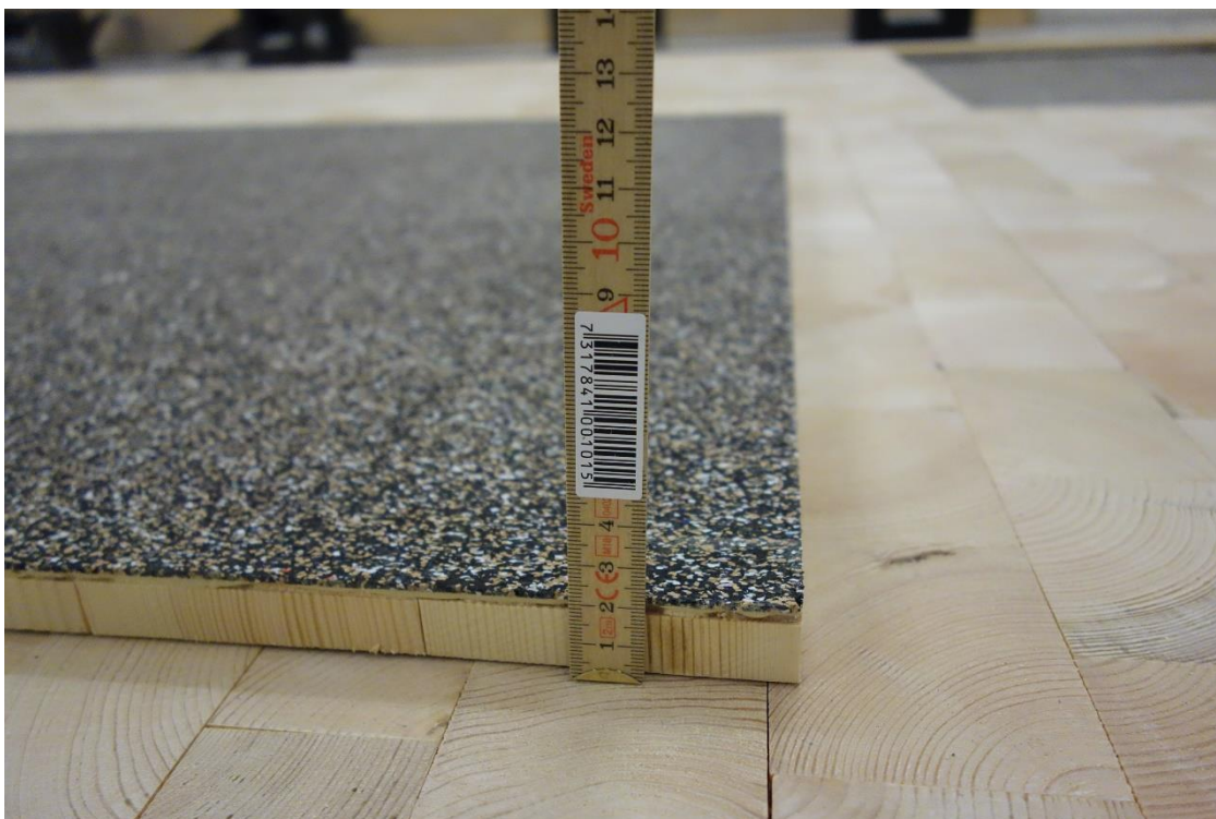
Bild 3 – Sidovy av korkmatta (vänd upp och ner) limmad mot kubbträbitarna. Inget lim förekommer mellan trä-kubbarna.